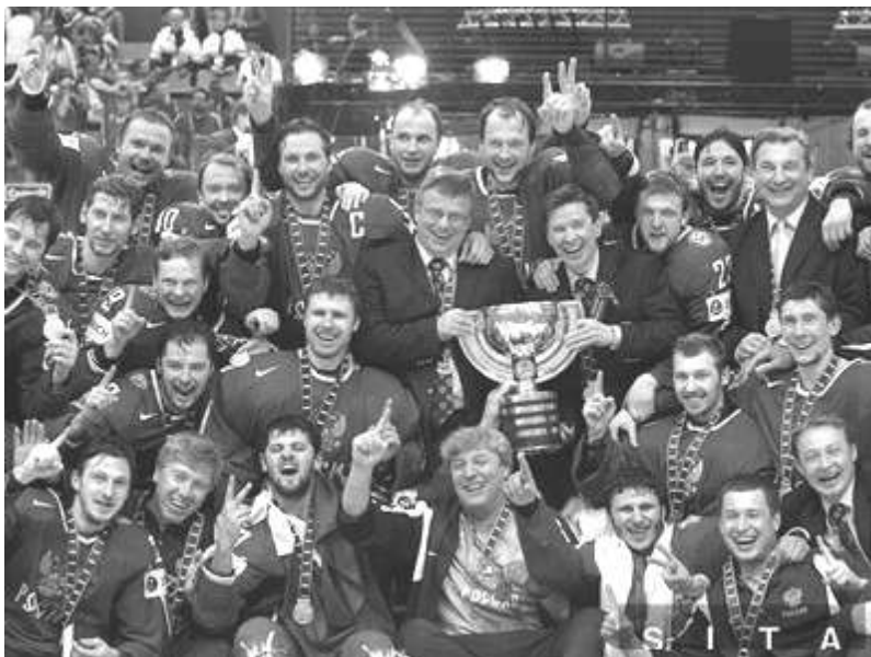
Ruskí zlatí medailisti.